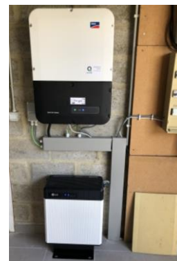
Omvormer (boven) en de LG RSU10 thuisbatterij (onder) (Q-Home).