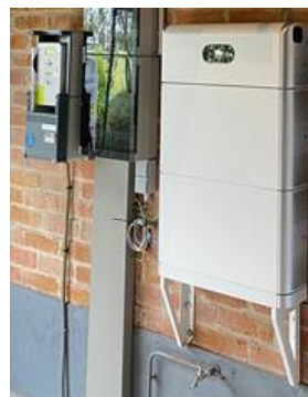
Huawei-omvormer en -thuisbatterijen (10 kWh) (MR Solar)